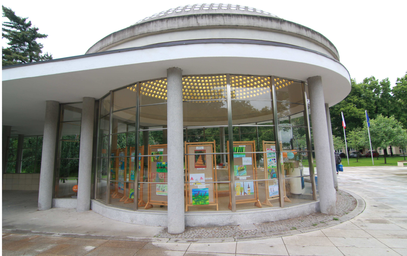
Výstava dětských prací v rámci projektu podpořeného TPCA