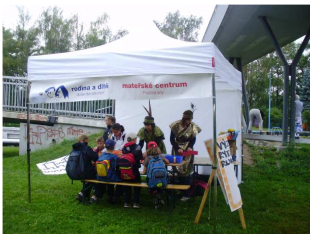
Rytířský den v srpnu