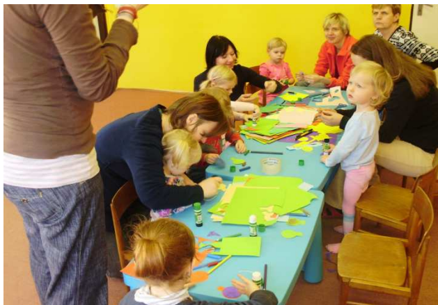
kroužek Výtvarka se Šikulkou